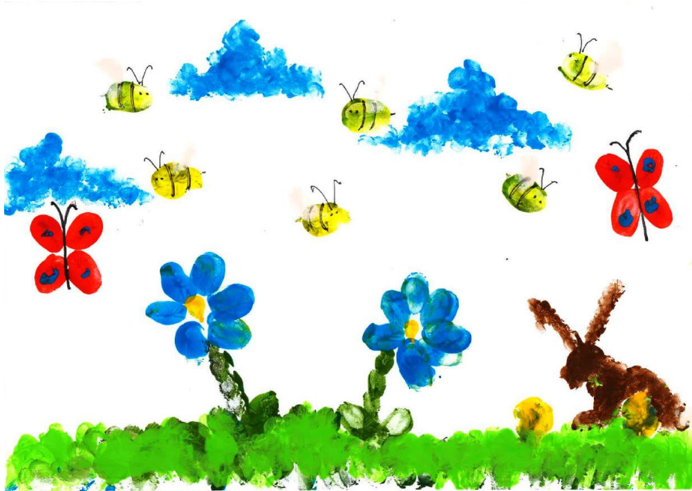
PhorMinis finger print picture